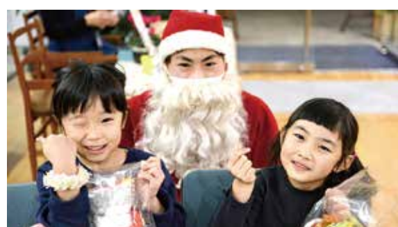
Amazon みんなでサンタクロース