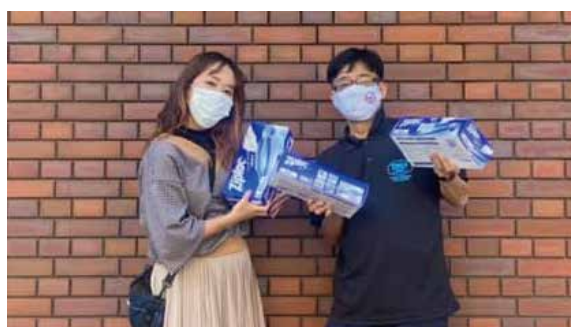
一人親家庭支援フードバンクサポート