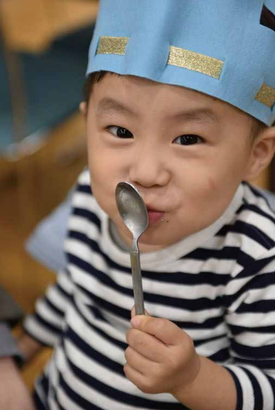
2021年度はこども食堂などの地域の課題に取り組みました。

ひとりがよくなると世界はきっとこう変わる。 ひとりが「よくなる」と、どんなコトが起きるだろう。 ひとりが「よくなる」と、 その人と出会った誰かがうれしくなる。 つまり、その人もきっと「よくなる」。 そして「よくなる」の繰り返しは社会や世界を よりよく変えていくチカラになると思うのです。 その人と出会った誰かが「よくなる」 そんな出会いとつながりをYMCAは これからも大切にしたいと考えています。 「よくなる」の連鎖はやがて 社会や世界を変えていくチカラとなっていく。 そしてきっと平和を形にしていける原動力となっていく。